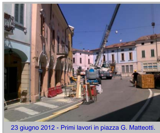
23 giugno 2012 - Primi lavori in piazza G. Matteotti.

29 maggio - Messa in sicurezza della torre campanaria. Lavori conclusi - oggi riaperta grazie ad interventi integrativi svolti dalla proprietà.