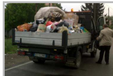
Pulizia area scarico abusiva - mag. '12

Dallo scorso maggio con il passaggio al sistema di raccolta "porta a porta" la quantità di rifiuto differenziato è decisamente aumentata, sempre superando il 75%, obiettivo minimo previsto al momento della partenza del servizio. In particolare è aumentata la quantità raccolta in modo differenziato di rifiuto organico (da 0 a 40/50 t./mese), di plastica (da 3 a 12-17 t./mese), di carta (da 10 a 20-25 t./mese), di vetro (da 15 a 20-25 t./mese). Con l'avvio del sistema ed a seguito del terremoto sono poi aumentati gli ingombranti consegnati direttamente in piazzola (da 10 t./mese di aprile a 20-22 t./mese di maggio e giugno). Il costo della TARSU 2012, come annunciato negli incontri di presentazione, è aumentato del 10%, passando per quanto riguarda le private abitazioni da 1,76 €/m 2 del 2011 a 1,94 €/m 2 del 2012. Non si paga la TARSU sulle abitazioni dichiarate inagibili. Dopo un'assemblea con i cittadini si è deciso che, dal 1 gennaio 2013, la raccolta del RIFIUTO SECCO (INDIFFERENZIATO), sia a settimane alterne. Tutte le informazioni nel calendario allegato.