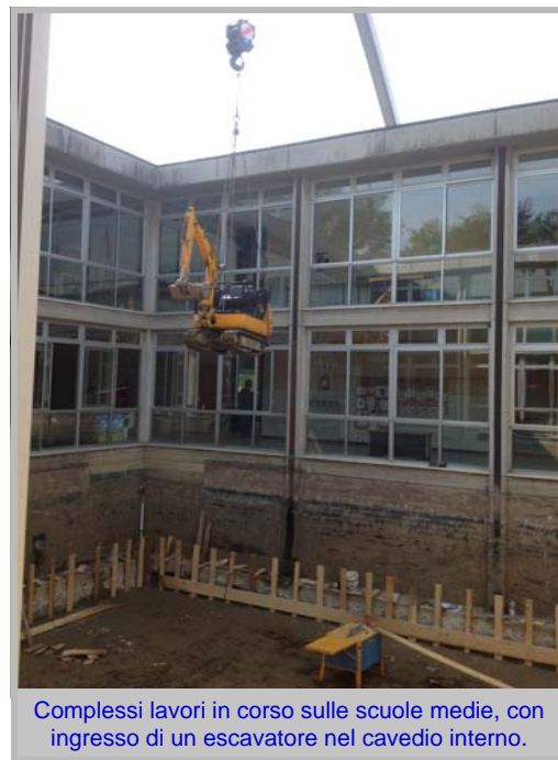
Complessi lavori in corso sulle scuole medie, con ingresso di un escavatore nel cavedio interno.

La struttura non ha subito danni, ma trattandosi di costruzione in prefabbricato si è deciso di intervenire con l'adeguamento alla più recente normativa antisismica. Prima fase: collegamento setti verticali / orizzontali: conclusa e scuola aperta. Seconda fase: miglioramento sismico - in corso.